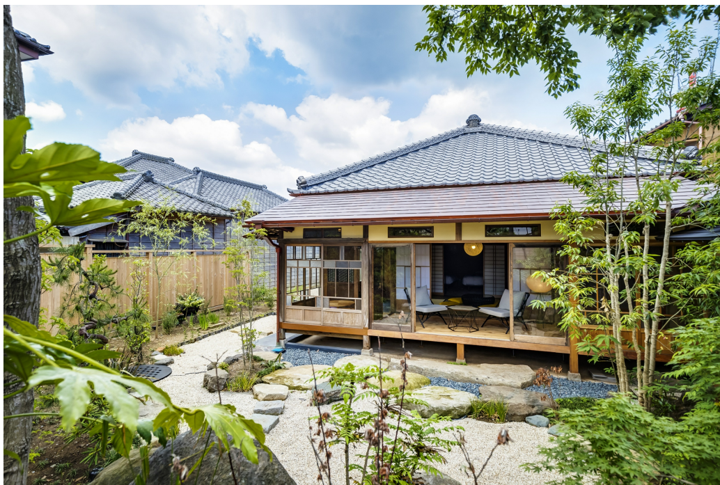
まちに点在する分散型ホテルは一棟貸し切りも可能

VMG HOTELS & UNIQUE VENUESのホテルは、伝統的建造物群保存地区に残る建造物や国指定文化財を活かしたブティックホテルです。そのまちや建物の歴史を背景としたコンセプトを生かしたホテルで、まちに溶けこむように泊まる、時を越えた体験をご提供いたします。現在全国12ヶ所で展開するグループ会場において、1棟の客室数も最大5室程度、各部屋の入り口も離れているため、プライベートな滞在をお楽しみいただけるほか、一棟貸し切りなど密を回避した小規模分散型ホテルであることから安心安全の旅をお届けしています。