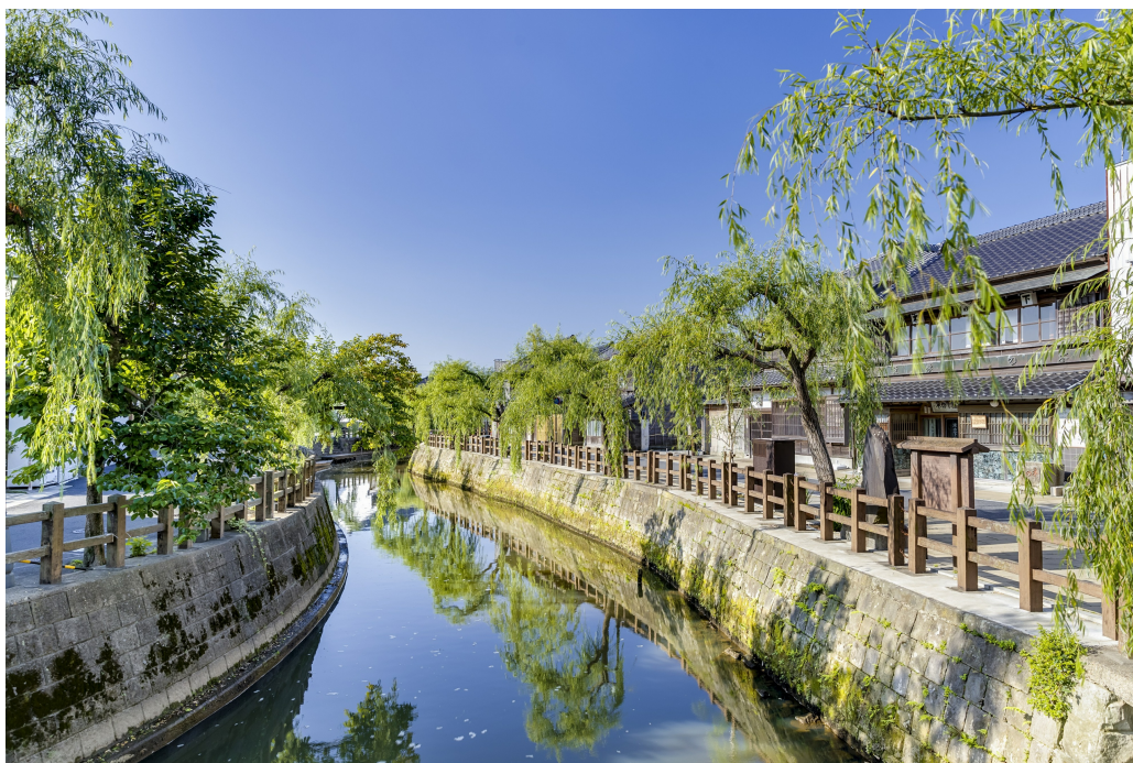
東京からもアクセス◎。重要伝統的建造物群保存地区に指定されている商家町 佐原。

例１：千葉県香取市 佐原商家町ホテル NIPPONIAに滞在する旅のモデルコース。 東京からも80分で行けるショートトリップが可能。