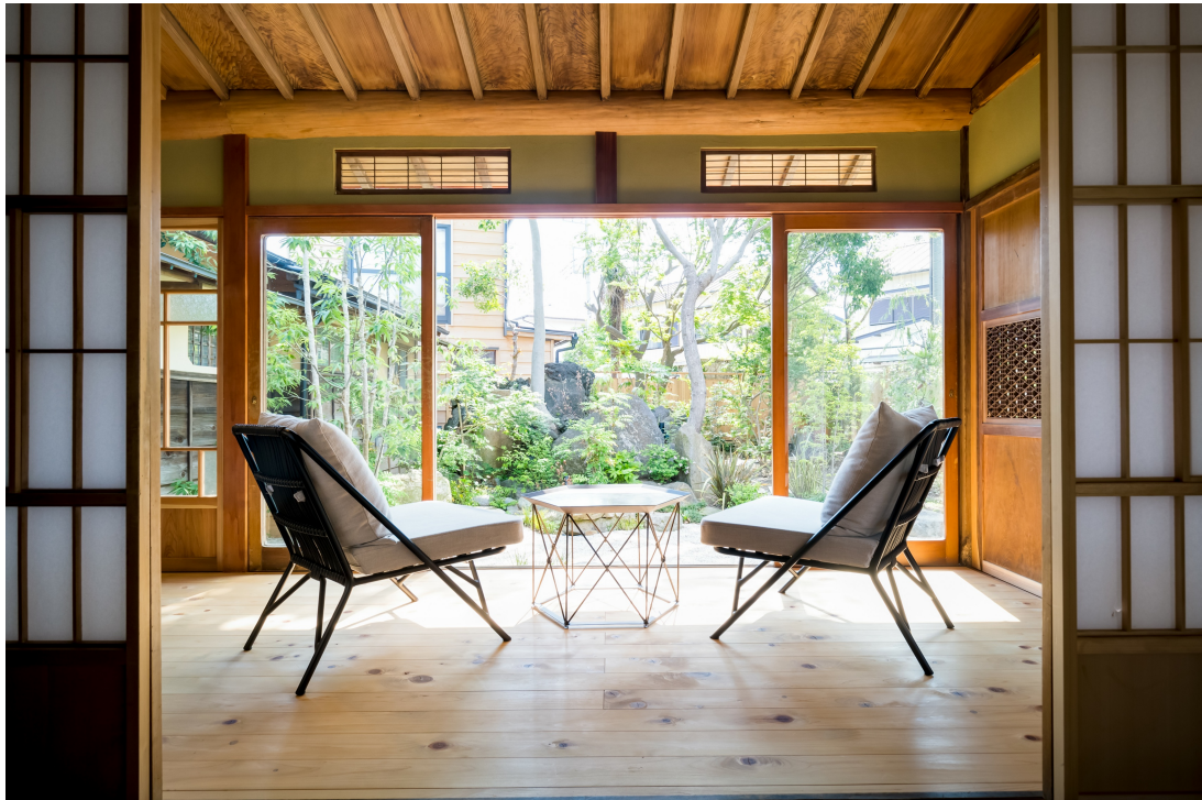
昭和初期の建物。元は柳半別邸と呼ばれ、地元の方々に愛された料亭を営んでいました。夏と秋の大祭では目の前を山車が通る特等席となります。