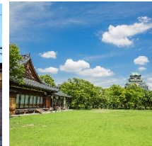
大阪城西の丸庭園 大阪迎賓館