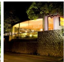
ザ・ヒルサイド神戸