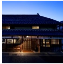
篠山城下町ホテル NIPPONIA