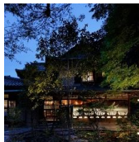
アカガネリゾート 京都東山1925