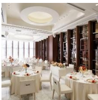
ザ・スイート銀座