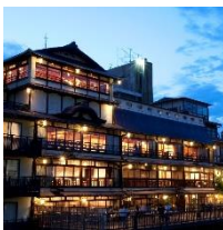
鮎鶴京都鴨川リゾート