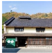
竹田城 城下町ホテル EN (旧木村酒造場)